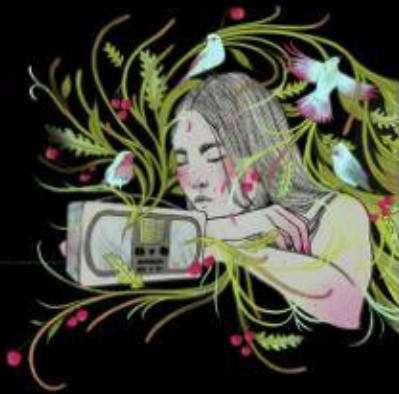
Ditzingen DE 31/08/21