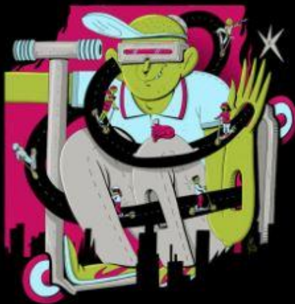
Langenhagen DE 02/09/21