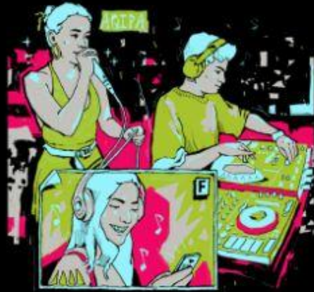
Brussels BE 01/09/21